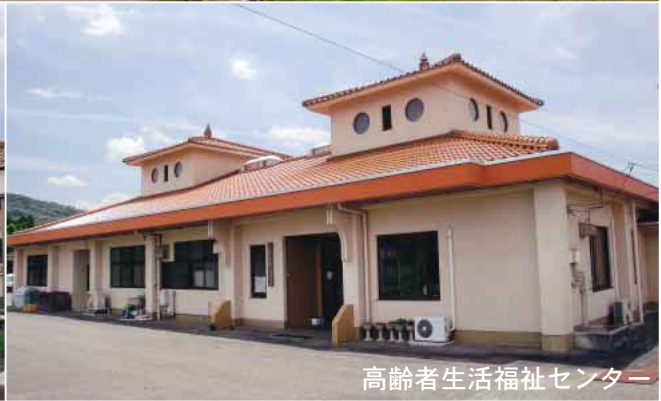
高齢者生活福祉センター