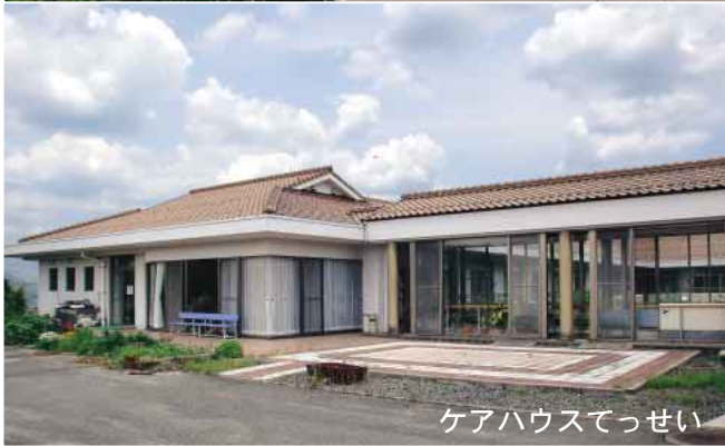
ケアハウスてっせい