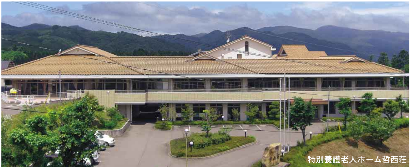
特別養護老人ホーム哲西荘

〒719-3701 岡山県新見市哲西町矢田4351 TEL 0867-94-3533 FAX 0867-94-3535 http://www.tesseisou.jp