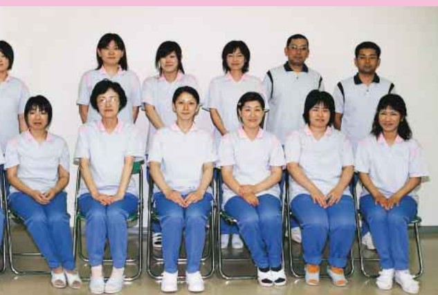
いただけるよう全員（寮母室・医務室一同）

居者に応じた のバランスは ろんのこと、 感や行事食を にし、手作り だわった食事 しんでいただ います。家庭 囲気に近い充 た食事を提供 るよう日々努 めています。